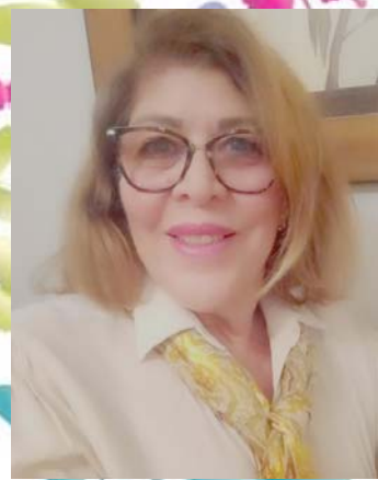
Por Regina Paiva