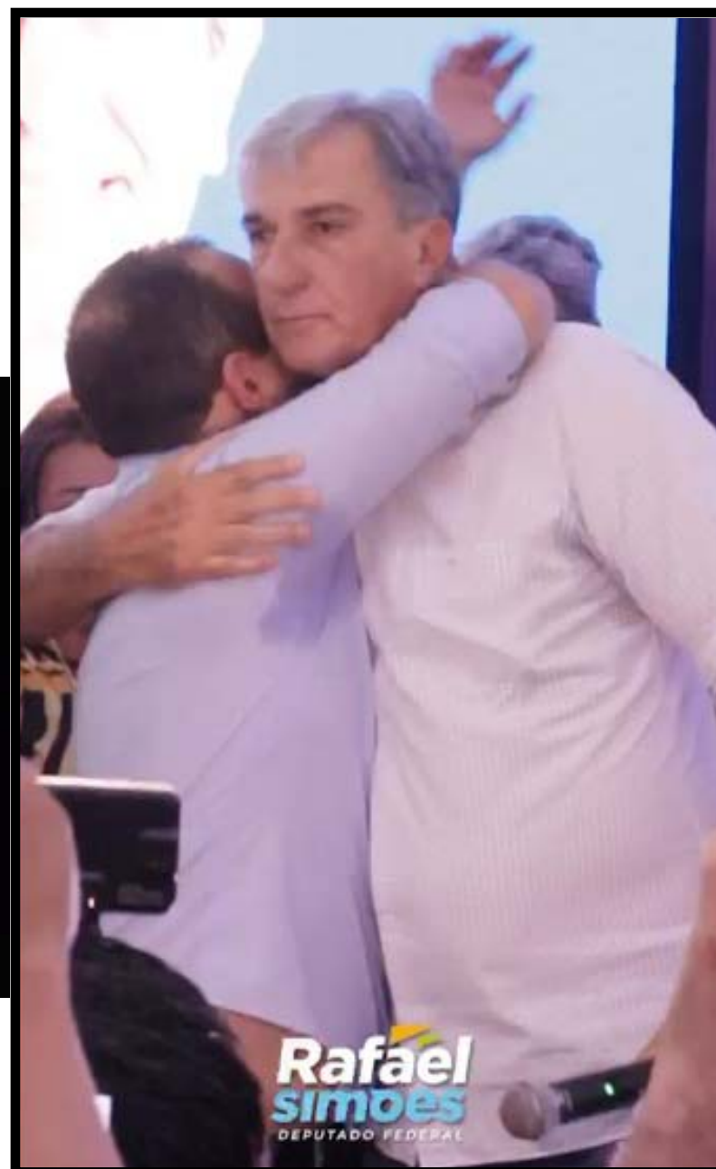
Abraço do dia 23/03/2024 por ocasião da indicação do nome do vereador a pré-candidato a prefeito pelo União Brasil

O sonho do vereador de disputar a prefeitura foi adiado, sabe-se lá DEUS para quando.